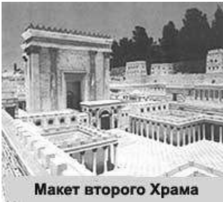
Макет второго Храма

Означает оно объект, при помощи которого человек делает шаг навстречу, приближается к Всевышнему. Как это происходит практически? Он отдает что-то, принадлежащее ему (домашнее животное из его стада или купленное на его деньги специально для этой цели, часть собственного урожая, вообще, часть имущества) Всевышнему. Но как можно вообще отдать Ему что-то? Ведь бессмысленно даже предполагать, что Он в чем-то нуждается — в нашем, земном смысле. Но если мы делает что-то согласно установленным Им законам, в данном случае — согласно точно определенным в Торе законам о приношении корбанот — это и означает, что действия наши сущностно верны и все, что мы ожидаем от понятия "приношение корбанот", свершится, т.е. корбан будет принят Им в ответ... Здесь-то и кроется весь смысл этого действия. Ведь отдать что-то свое (и тем самым признать, что все, чем вла-