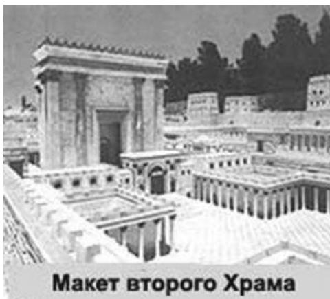
Макет второго Храма

Всевышний всегда, в любое время открывает двери перед тем, кто хочет вернуться к Источнику жизни, но подготовка и правильное проведение Йом Кипура помогают сделать это тверже и глубже.